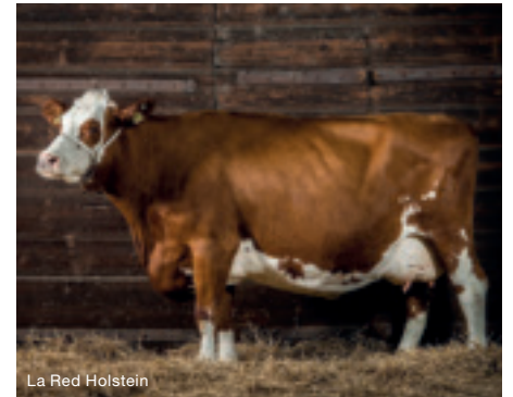
La Red Holstein

La production journalière varie de 15 à 30 litres par vache et dépend de nombreux facteurs (race, alimentation, saison, cycle biologique, hérédité, etc.).