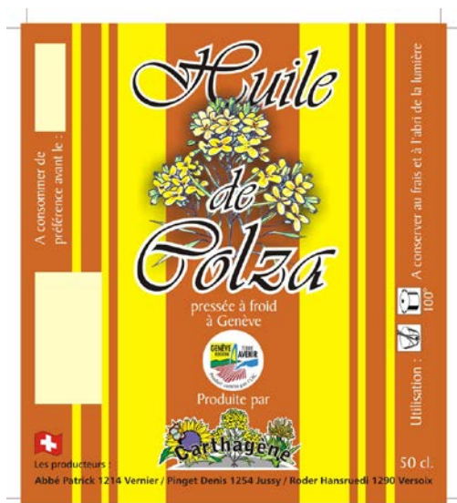
Etiquette Colza 2010 Format 1/1 110 x 125 mm 50 cl