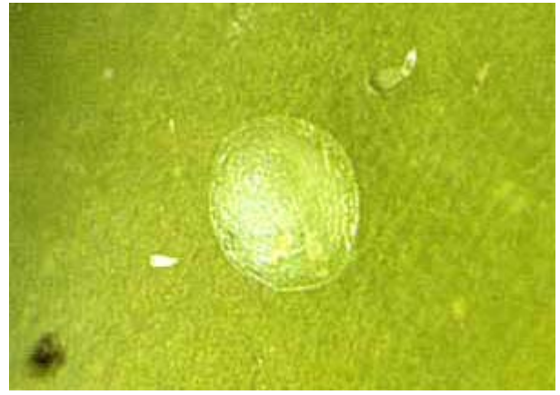
Œuf déposé sur une baie en seconde génération. (Photo D. Quattrocchi).

également disponibles. Plusieurs esters phosphoriques et carbamates sont aussi homologués, mais ils sont plus toxiques et plus nocifs pour la faune utile.