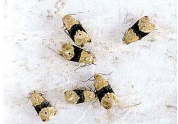
Papillons mâles de cochylis pris dans la glu du piège.