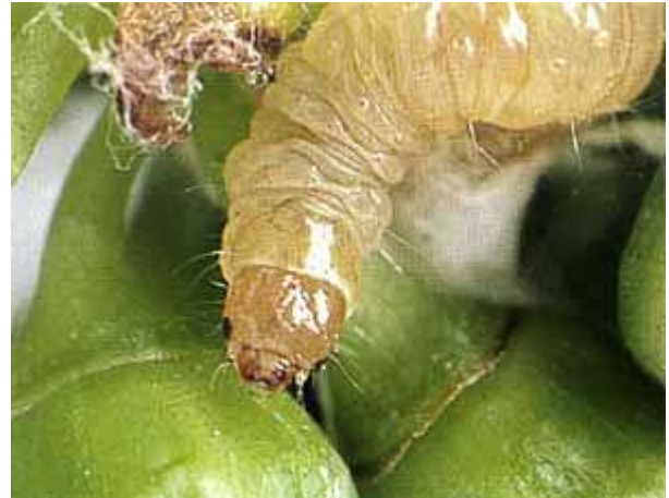
Larve d'eudémis avec son tissage en première génération.