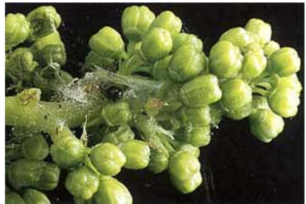
Grappe avant la floraison avec un glomérule et une larve.