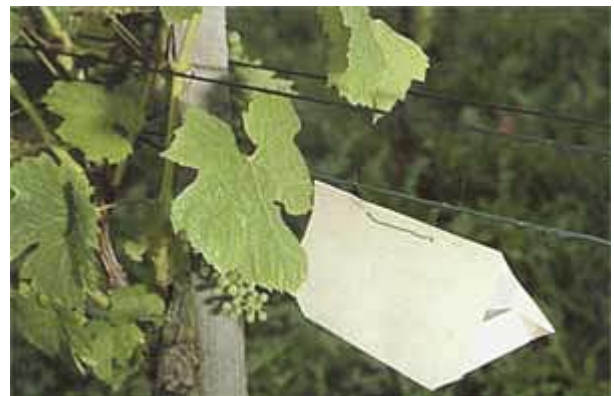
Piège utilisé pour le contrôle du vol des papillons.