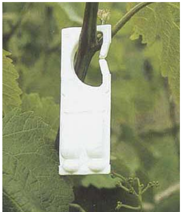
Diffuseur contenant de l'attractif sexuel synthétique pour la lutte par confusion contre la cochyliis.

Elaboré par Agroscope RAC et FAW Wädenswil.