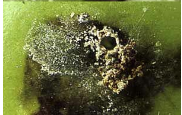
Attaque de deuxième génération avec détail de la pénétration dans la baie.