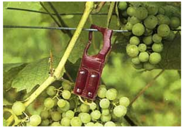
Diffuseur contenant de l'attractif sexuel synthétique pour la lutte par confusion.

La lutte peut généralement être évitée en première génération, car le seuil de tolérance est élevé. Par contre, elle est presque partout nécessaire en seconde génération et les moyens d'intervention sont nombreux: la lutte par la technique de confusion est une méthode préventive spécifique à réserver aux vignobles de plus de 10 ha et aux vignes isolées d'au moins 1 ha. Les diffuseurs doivent être installés au début du premier vol. Là où les deux espèces de vers de la grappe sont présentes, il faut opter pour les diffuseurs combinés. Bacillus thuringiensis (BT) est un insecticide biologique sélectif à appliquer au début des éclosions de la seconde génération. Des régulateurs de croissance d'insectes (RCI) épargnant les auxiliaires sont