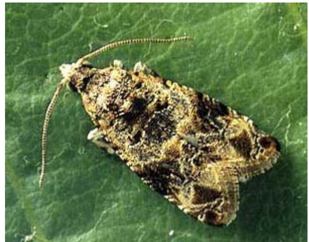
Papillon d'eudémis, Lobesia botrana . Envergure 11-13 mm.

Dans de nombreux vignobles de Suisse romande ainsi que dans quelques vignobles de Suisse alémanique, l'eudémis est présente seule ou en mélange avec la cochylys. Son importance varie d'année en année selon les conditions météorologiques. Un temps chaud et sec favorise l'augmentation des populations de l'eudémis. Les papillons, issus des chrysalides qui ont passé l'hiver dans un cocon sous l'écorce, apparaissent dans les vignes dès la mi-avril ou au début de mai. Ils sont de moeurs crépusculaires. Le vol dure 3 à 5 semaines. Après l'accouplement, les femelles de première génération pondent 40 à 60 œufs sur les capuchons floraux ou les pédoncules. Après 10 à 15 jours, les petites chenilles sortent des œufs pour pénétrer dans un bouton floral, puis confectionnent un glomérule ou nid (amas de plusieurs fleurs réunies par un tissage). La