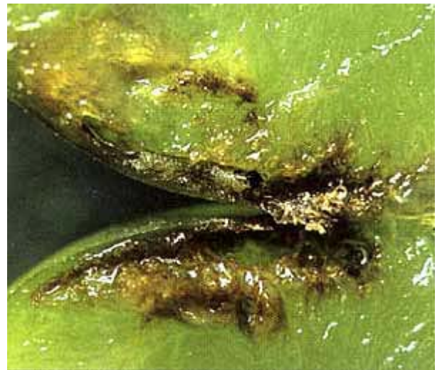
Coupe d'une baie attaquée lors de la deuxième génération.