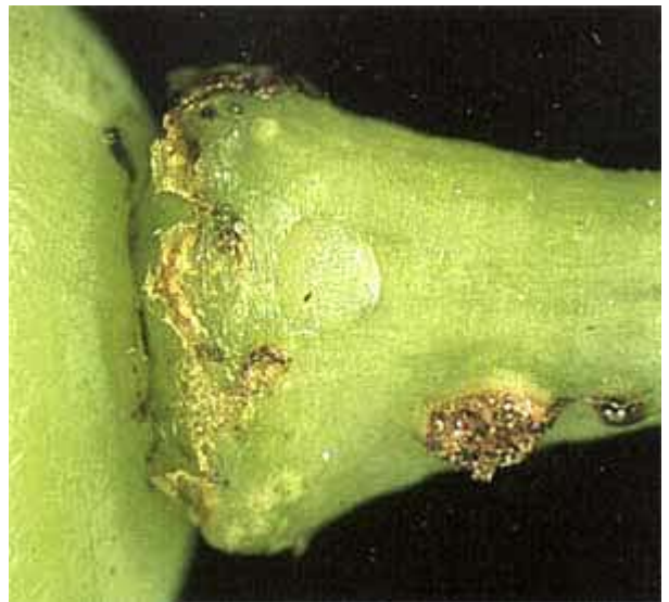
Oeuf déposé sur un pédoncule de baie durant le deuxième vol.