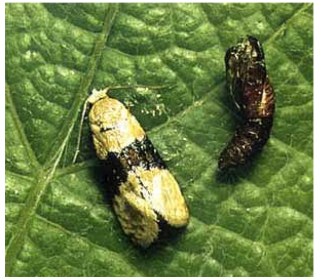
Papillon de cochylis, Eupoecilia ambiguella . Envergure 12 à 15 mm.

En Suisse, son importance varie d'année en année selon les conditions météorologiques. Un temps humide et des faibles écarts de température entre le jour et la nuit sont des conditions favorables à l'augmentation des populations. Les papillons, issus des chrysalides qui ont passé l'hiver dans un cocon sous l'écorce, apparaissent dans les vignes dès la mi-avril ou au début de mai. Ils sont de mœurs nocturnes. Le vol dure 3 à 5 semaines. Après l'accouplement, les femelles de première génération pondent 40 à 60 œufs sur les capuchons floraux ou les pédoncules. Après 10 à 15 jours, les petites chenilles sortent des œufs pour pénétrer dans un bouton floral, puis confectionnent un glomérule ou nid