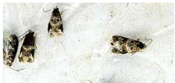
Papillons mâles d'eudémis pris dans la glu.