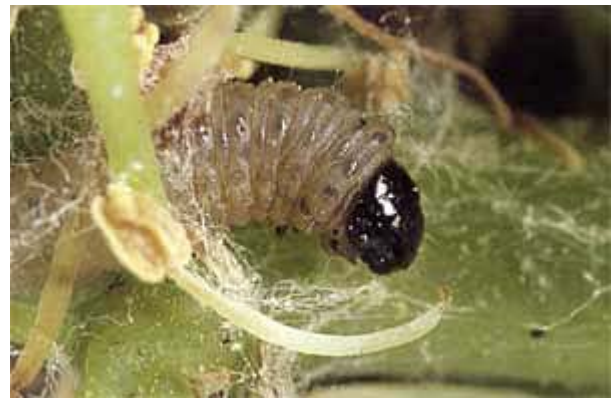
Larve de cochylis de première génération émergeant de son tissage.

La lutte peut généralement être évitée en première génération, car le seuil de tolérance est élevé. Par contre, elle est presque partout nécessaire en seconde génération, et les moyens d'intervention sont nombreux: la lutte par la technique de confusion est une méthode préventive spécifique à réserver aux vignobles de plus de 10 ha et aux vignes isolées d'au moins 1 ha. Les diffuseurs doivent être installés au début du premier vol. Là où les deux espèces de vers de la grappe sont présentes, il faut opter pour les diffuseurs combinés. Bacillus thuringiensis (BT) est un insecticide biologique sélectif à appliquer au début des éclosions de la seconde génération. Des régulateurs de croissance d'insectes (RCI) épargnant les auxiliaires sont également disponibles. Plusieurs esters phosphoriques et carbamates sont aussi homologués, mais ils sont plus toxiques et plus nocifs pour la faune utile.